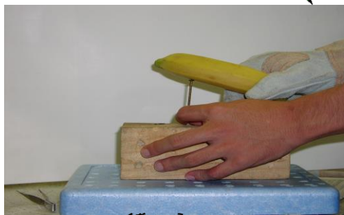
バナナで釘が打てる！ ...そんな“ぼなな”？！