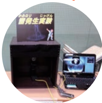
雷 (真空放電) を発生させて 観察するよ!