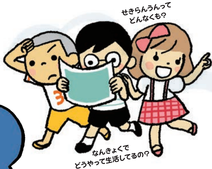
せきらんうんって どんなくも?