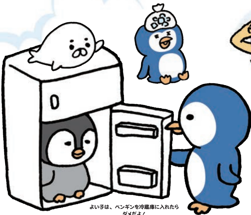
よい子は、ペンギンを冷蔵庫に入れたら ダメだよ!