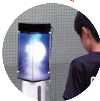
竜巻を人工的に発生させて 観察するよ!