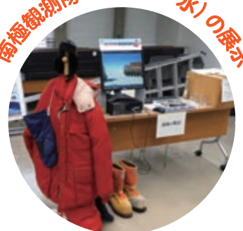
南極観測の紹介と 南極のなぜ?を解説するよ!